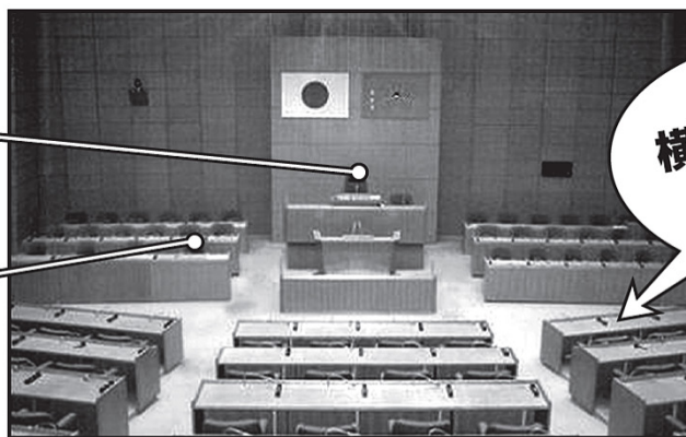
〈奈良市議会 議事堂〉