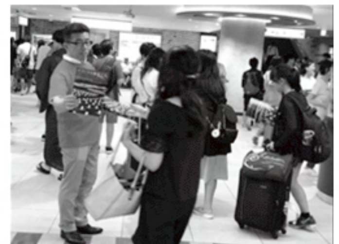
近鉄奈良駅前ガイドマップ配り

1999年から始めた「なら燈花会」は今年20周年の節目でした。市民ボランティアによる手づくりは今年も健在。中心となってがんばられた方々には及びませんでした。今年15年ぶりに、「国立博物館会場」で点灯現場に復帰。また近鉄奈良駅前でのガイドマップ配りに加わる事ができました。