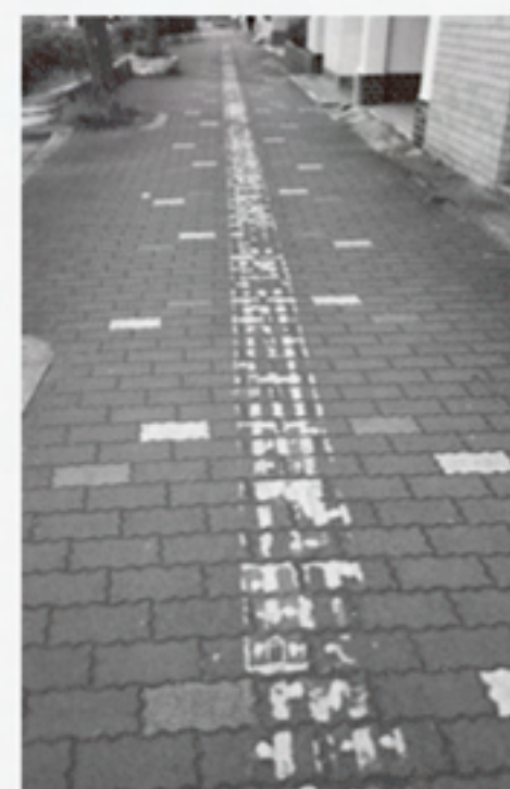
やすらぎの道点字ブロック (2018年5月時点の様子)

点字ブロックの適切な敷設の仕方等を関係部局が課題を持ち寄り、障害者団体と直接意見交換の場を設ける等、仕組みづくりをする。